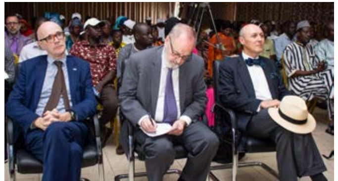
De gauche à droite : l'Ambassadeur de l'Union européenne ; l'ambassadeur du Royaume de la Belgique ; l'Ambassadeur de la République Fédérale de l'Allemagne