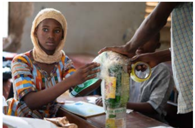
Des enfants des clubs verts de SANUVA Initiatives en pleine séance de réalisation de différents types d'objets à partir des déchets recyclés.