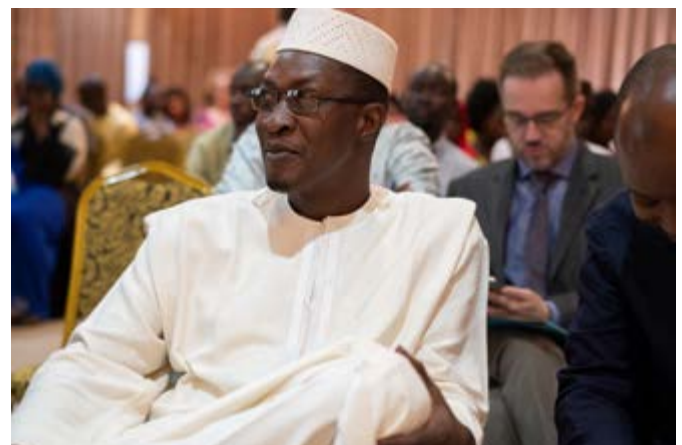
Housseini Amion Guindo, Ministre de l'Environnement, de l'Assainissement et du Développement durable

de l'Assainissement et du Développement Durable. L'objectif principal est de favoriser l'engagement actif et constructif des jeunes dans l'action pour le climat. « Le changement climatique est